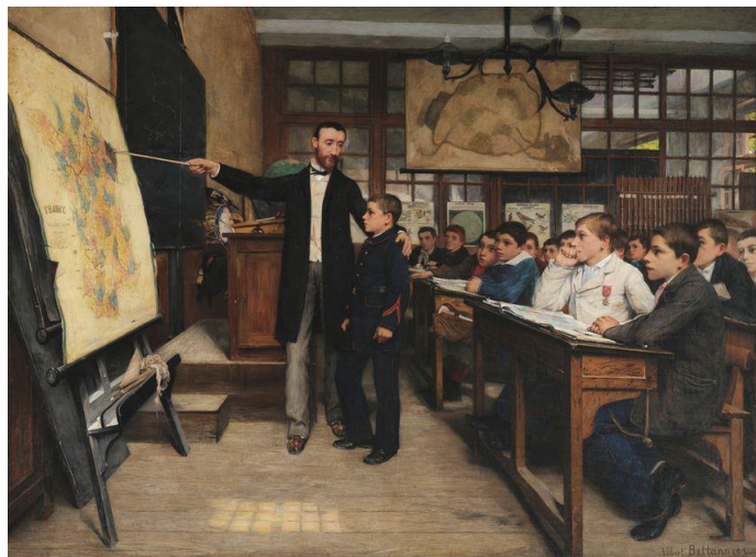
La Tache noire ou La leçon de géographie, 1887 - Albert Bettannier

"Durant toute la IIIe République, si vous relisez les manuels d'instruction civique de l'école primaire, aussi bien laïque que catholique, on définit toujours le bon citoyen par le fait qu'il va voter. On ajoute même qu'il va voter "en ne tenant pas compte de ses intérêts spécifiques". Et on pense que cette norme civique suffit pour que le système électoral fonctionne."